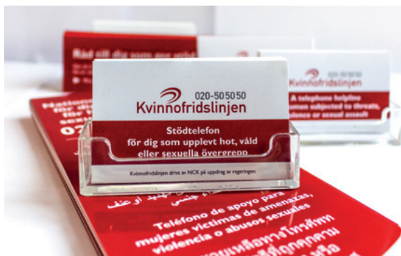
Informationskorten med Kvinnofridslinjens nummer finns översatta till 28 språk förutom svenska samt punktskrift.